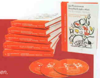
Gesualdo Consort Amsterdam

Deel II: De Psalmen Davids, Deel II A: Eerste Boek der Psalmen Davids, Glossa GES 922402 (3 cd's); Deel II B: Tweede Boek der Psalmen Davids, Glossa GES 922403 (3 cd's); Deel II C: Derde Boek der Psalmen Davids, Glossa GES 922404 (3 cd's); Deel II D: Vierde Boek der Psalmen Davids, Glossa GES 922405 (3 cd's); Deel III: De Cantiones Sacrae, Glossa GES 922406 (2 cd's)